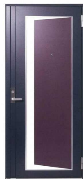
未来守くん™ 避難扉付き対震玄関ドア (※特許 第5322181号) PB-bs