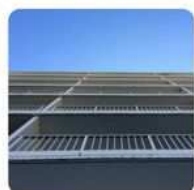
ベランダの落下防止