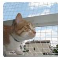
犬猫の侵入・転落防止