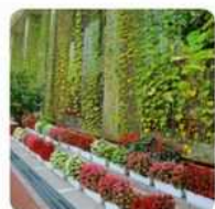
グリーンカーテン 夏の間は有効活用ください。