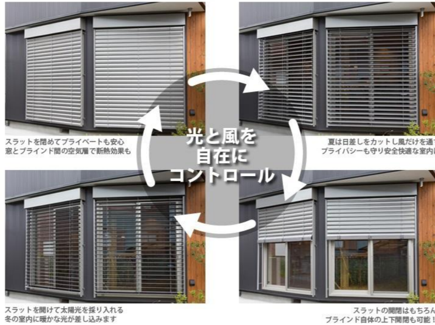
スラットを閉めてプライベートも安心 窓とブラインド間の空気層で断熱効果も

ドイツ、スイス、オーストリア、などの環境先進国といわれている国では、住宅や公共施設や病院、学校までも広く一般的に使われています。特に環境先進国ドイツでは、外付けブラインドの効果で冷暖房エネルギーの節約ができ、二酸化炭素の削減にもつながるため、スタンダードな設備として認知されています。