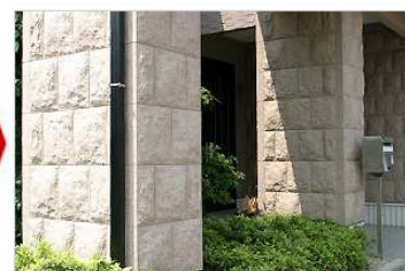
下地材/サイディング