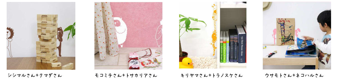
シマルさん+クマダさん モモチ子さん+トサカリアさん キリヤマさん+トラノスケさん ウサモトさん+ネコハルさん