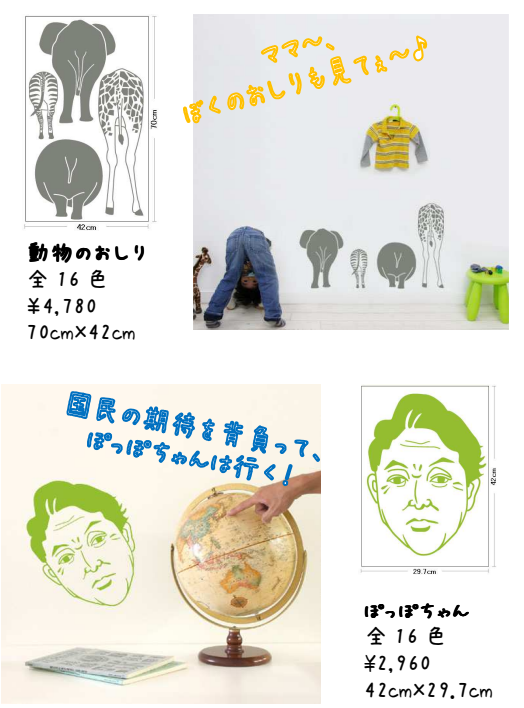
動物のおしり 全16色 ¥4,780 70cm×42cm