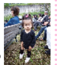
恐怖体験した ころちゃん(°Д´)

季節のお手入れ 今1月 暖房器具の準備 すきま風の防止 断熱材の活用などを行って、来る冬に備えましょう。