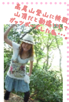
高尾山登山に挑戦! 山頂だと勘違いして グッツボウをした...