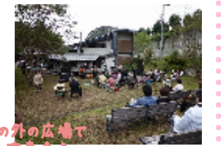
アトリエの外の広場で プロの演奏会♪