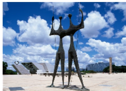
三権広場に立つ、労働戦士の像

クビチェック大統領記念館 ブラジリア建設の父、クビチェック元大統領の墓所で、巨大な棺を思われる独特なフォルムが印象的。