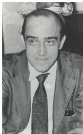
オスカー・ニーマイヤー 建築家