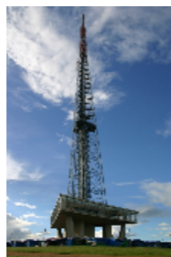
218mのテレビ塔 75mに展望台がある。