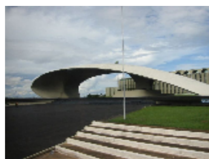
ペドロ・カルモン・シアター