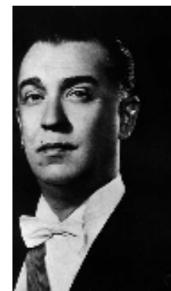
ジュセリーノ・クビシェック・デ・オリヴェイラ 24代ブラジル大統領