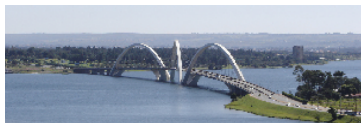
ジュセリーノ・クビシェッキ橋